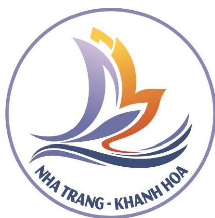
Hình 2. Mẫu tiếng Anh