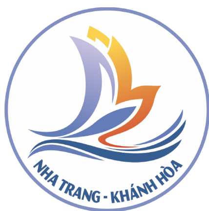
Hình 1. Mẫu tiếng Việt